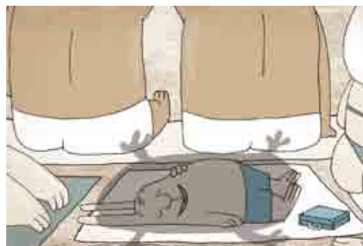
The Mole at the Sea