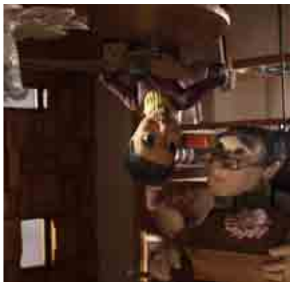
Head over Heels