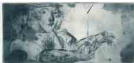
With thread and needle, Dry point, carborundum

Μεσαιωνική Αγρέπαυλη, Παλαίπαφος - Κούκλια Ancient Site of Palaeraphos - Kouklia