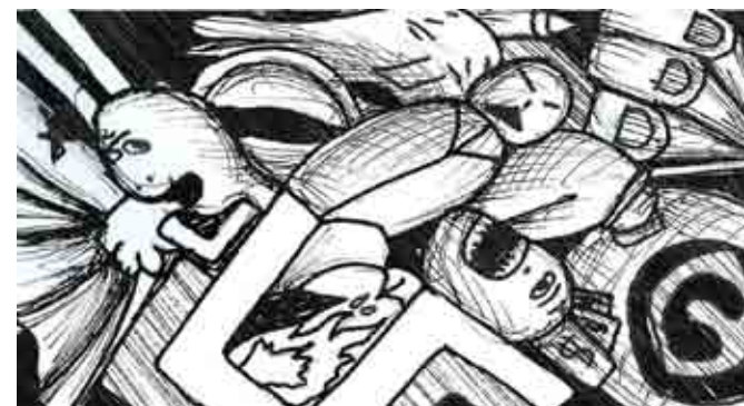
Dance of Mass