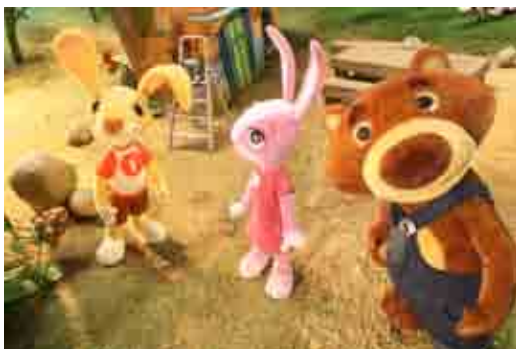
Flapper and Friends

Μεσαιωνική Αγρέπαυλη, Παλαίφαρος - Κούκλια Ancient Site of Palaeraphos - Kouklia