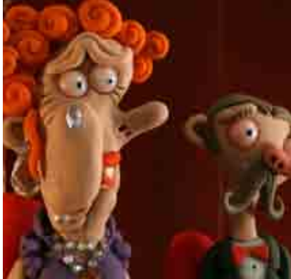
At the Opera