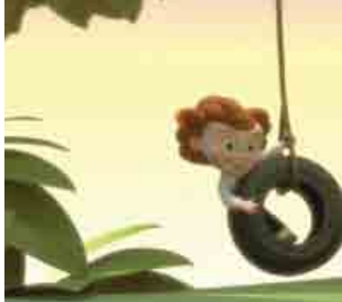
Off the Hook