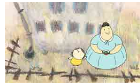
The Farmer and the Robot

Παρασκευή / Friday 17, 10:00 Columbia Hotels & Resorts