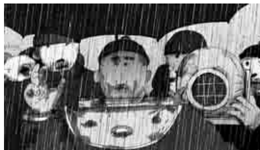
Divers in the Rain