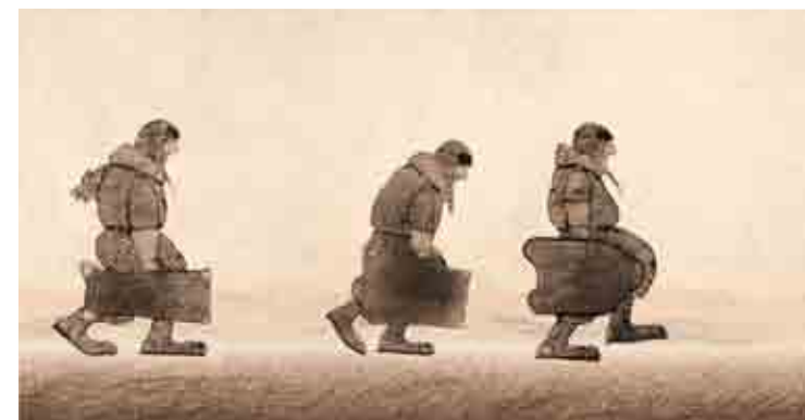
Pilots on the Way Home